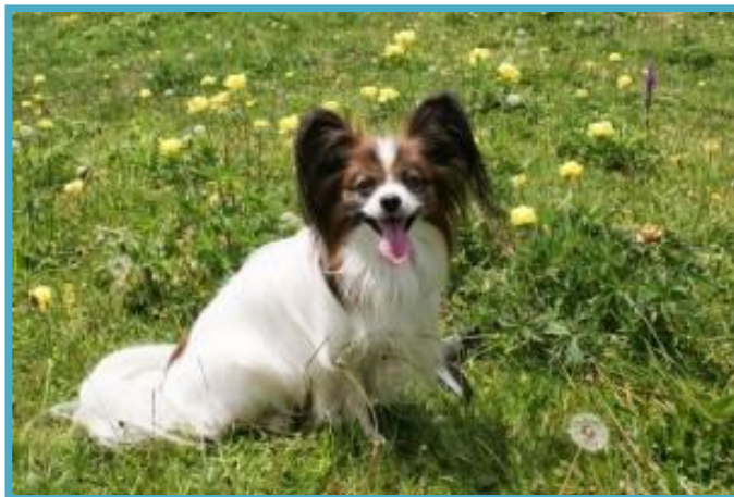
Podi na Krvavcu

Po dolgem času smo odšli spet v hribe. Lep sončni dan smo preživeli na Krvavcu. Travniki, polno rož in veliko poti. Podi je užival v raziskovanju, a je bil proti koncu dneva že kar prijetno utrujen. Na poti nazaj pa je doživel neprijetno prigodo. Ko smo hodili po makadamski poti, sem na tleh opazila ogromno velikih mravelj. Ker je Podi začel hoditi tesno ob meni sem opazila, da je z njim nekaj narobe. Ugotovila sem, da so ga mravlje dobesedno napadle. Lezle so mu po telesu, da ga je vse srbelo in se jih nikakor ni mogel otresti. Ko si jih je hotel odstraniti in se je usedel ali ulegel na tla, so mravlje to hitro izkoristile. Nato sem mu začela metati žogico, da je tekel naprej in naprej in prišel na del poti, kjer mravelj ni bilo več ter si jih tam uspel večinoma odstraniti. Konec dober, vse dobro.