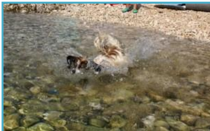
Skok v vodo