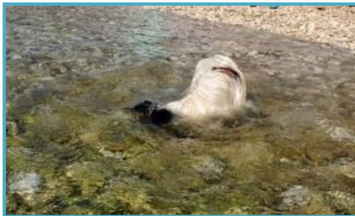
Iskanje žogice pod vodo