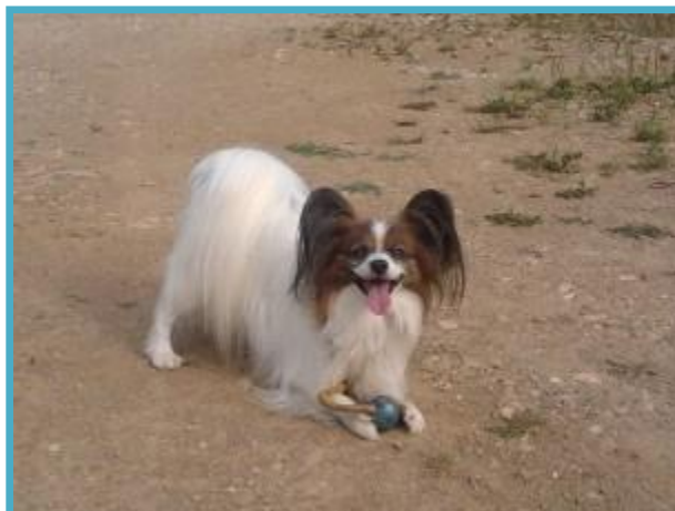
Metanje žogice je še vedno in ;)