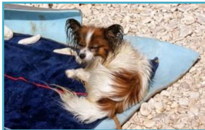
Lenarjenje na plaži