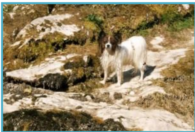
Mokri Podi pri suhem slapu

Kasneje smo se podali še na bližnji hrib, kjer se je Podi hitro posušil in mu je bilo kmalu že pošteno vroče.