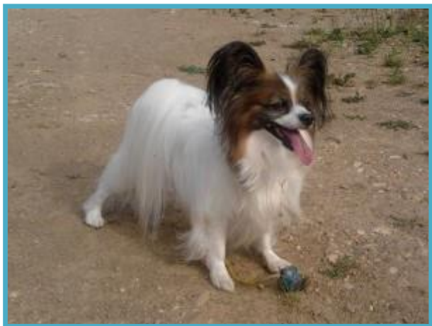
Podi je star 7 let