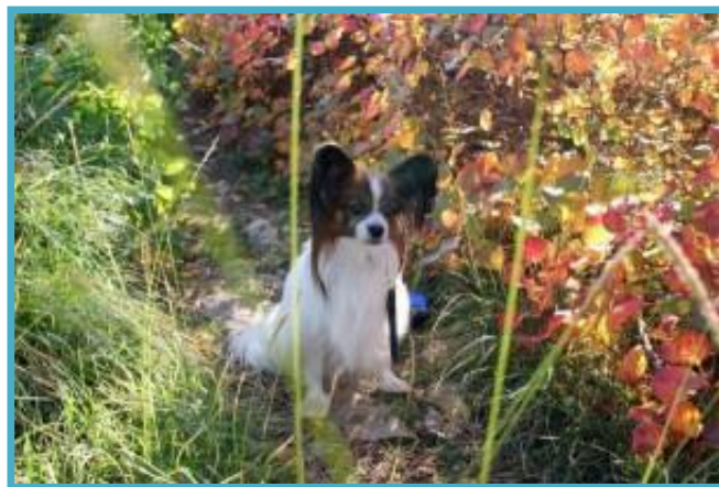
Poziranje ob ruju