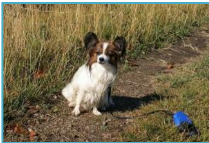
Pri električni žici

Tokrat smo odšli na izlet na Sv. Jakoba nad Ljubljano. Hodili smo po cesti, gozdni poti in travnikih. Podi je seveda kot vedno raziskal vsak kotiček ob poti. Tokrat pa je bil njegov radovedni nos nepreviden in zelo kaznovan. Po nesreči je namreč hrabro skočil skozi ograjo - električno žico. Še sam ni vedel, kaj ga je doletelo. Bil je čisto šokiran in je na ves glas piskal ter hotel celo po isti poti nazaj. Uspelo mi ga je umiriti in lepo prenesti nazaj na drugo stran. Podi pa je bil takoj za tem skregan z električno žico.