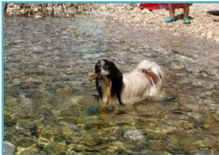
Zmaga! - našel žogico

c) in zmagovalni pogled iz vode - seveda z žogico.