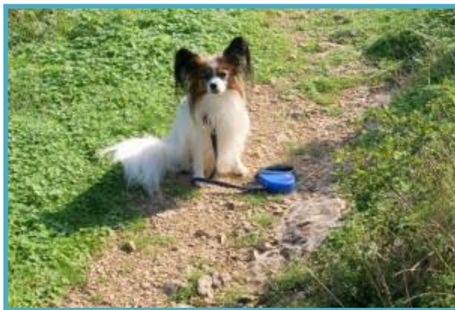
Utrujen - gremo domov