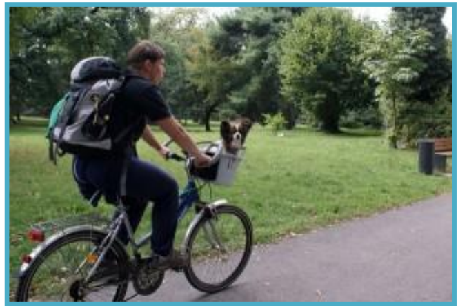
Gospod v košari