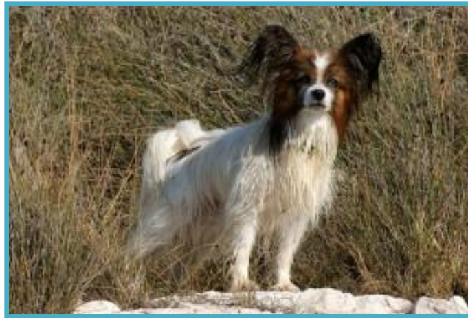
Podi v Premanturi

Ampak po vseh letih obiskovanja je Podi tam še vedno zelo zadovoljen, saj ima ponudbo 'all inclusive':