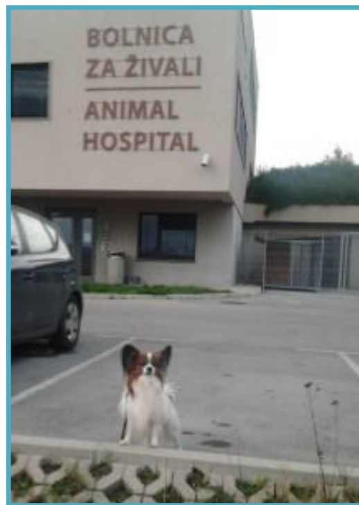
Podi pred bolnico

Po kastraciji se je Podijevo počutje izboljšalo in težav z nemočjo v zadnjih nogah ni bilo več. Vseeno pa se mu v skoraj mesecu dni niso vidno izboljšale težave pri kakanju. Poleg tega sem občasno opazila bulo bo njegovem repu. Bula je včasih bila, drugič je ni bilo. A ker sem jo opazila večkrat, sem se odločila za ponoven obisk veterinarja. Poleg tega je Podi ponovno imel težave z vnetjem ušes, zato sva tokrat odšla k najbližjemu veterinarju na svetovanje. Ta ga je zelo temeljito pregledal, nato pa mu predpisal zdravilo za ušesa in mi razložil precej črni scenarij Podijevega zdravstvenega stanja. Bila sem čisto pretresena, zato sva naslednji dan za mnenje odšla vprašati tudi svojega veterinarja. Tudi ta je žal potrdil diagnozo - Podi ima perinealno hernio in bo moral ponovno na operacijo. Ker je operacija bolj kompleksna, sva bila napotena v Bolnico za živali v Postojno . Najin veterinar dr. Tacer se je zelo zavzel in nama uredil pregled pri specialistu še isti dan. Tudi dr. Butinar je potrdil diagnozo, a je bil na srečo glede operacije precej bolj optimističen kot oba splošna veterinarja. Glede na to, da naj bi opravil že preko 800 takšnih operacij, sem bolj optimistična odšla domov. Podi pa je dobil datum operacije čez 10 dni, do takrat pa bo moral jesti čim bolj tekočo hrano, ki mu bo olajšala izločanje.